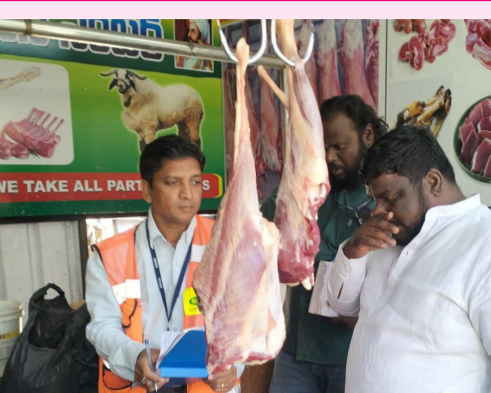
లైసెన్స్ లేకపోవడంతో కేసులు నమోదు

నిజం న్యూస్ హైదరాబాద్, ఫిబ్రవరి 20: సమాచార హక్కు