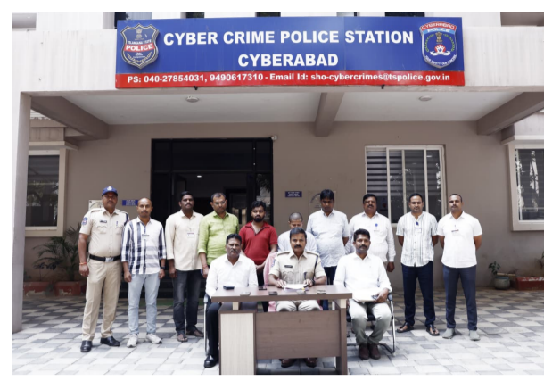
నిజం న్యూస్ హైదరాబాద్, ఫిబ్రవరి 27: నకిలీ వ్యాపార సంస్థల పేర్లతో మ్యూల్ బ్యాంక్ ఖాతాలు తెరిచి సైబర్ మోసాలకు