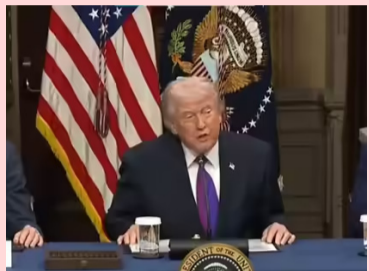
అమెరికా, ఇజ్రాయెల్ సంయుక్తంగా ఇరాన్ పై జరిపిన దాడుల నేపథ్యంలో అంతర్జాతీయ మార్కెట్ లో చమురు ధరలు భగ్గుమంటున్నాయి. అయితే ఈ ధరల పెరుగుదల కేవలం మిగతా 2రో

ఈ చమురు ధరల పెరుగుదల స్వల్పకాలికమే: ట్రంప్ 1983 తర్వాత ఇదే తొలిసారి నెలల తరబడి ఉండదు అమెరికా, ఇజ్రాయెల్ సంయుక్తంగా ఇరాన్ పై జరిపిన దాడుల నేపథ్యంలో అంతర్జాతీయ మార్కెట్ లో చమురు ధరలు భగ్గుమంటున్నాయి. అయితే ఈ ధరల పెరుగుదల కేవలం మిగతా 2రో