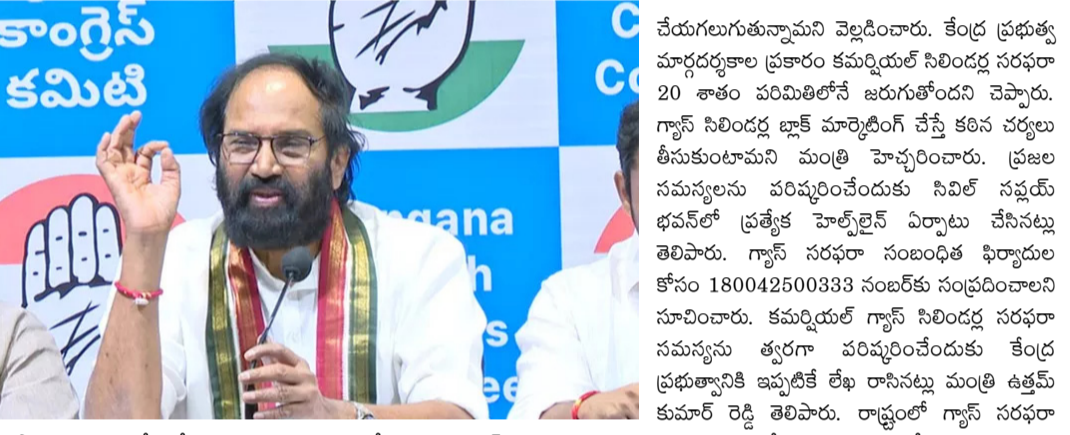
తెలిపారు. రాష్ట్రంలో రోజూ సుమారు 23 వేల కమర్షియల్ సిలిండర్లు అవసరం ఉండగా ప్రస్తుతం 6,200 మాత్రమే సరఫరా

రాష్ట్రంలో ప్రస్తుతం మొత్తం 811 ఎల్బీజీ డిస్ట్రిబ్యూటర్లు ఉన్నారని మంత్రి తెలిపారు. రాష్ట్రవ్యాప్తంగా సుమారు 1.3 కోట్ల గ్యాస్ కనెక్షన్లు ఉండగా, అందులో 11 లక్షలు ఉజ్వల పథకం, 28 లక్షలు డీపీఎం పథకం కింద ఉన్నాయని వెల్లడించారు. అదనంగా 7.5 లక్షల కమర్షియల్ కనెక్షన్లు కూడా ఉన్నాయని వెల్లడించారు. ప్రతి నెల రాష్ట్రంలో 58 లక్షల నుంచి 60 లక్షల వరకు గ్లాస్ వినియోగ గ్యాస్ సిలిండర్లు సరఫరా అవుతున్నాయని మంత్రి వివరించారు. ఇటీవల కొన్ని రోజులూ ప్రజల్లో అందోళన కారణంగా బుకింగ్ రెస్ట్రీంపు అవుతున్నాయని తెలిపారు. అయినప్పటికీ గ్లాస్ వినియోగ సిలిండర్ల సరఫరాలో ఎలాంటి సమస్య లేదని స్పష్టం చేశారు. ప్రతిరోజూ సుమారు 2.5 లక్షల గ్యాస్ సిలిండర్లు సరఫరా జరుగుతున్నాయని తెలిపారు. గత రోజు గ్రామీణ కుటుంబ కార్యకర్త గ్యాస్ సిలిండర్లు సరఫరా చేసినట్లు మంత్రి చెప్పారు. అయితే కమర్షియల్ సిలిండర్ల విషయంలో కొంత కొరత ఉన్నట్లు మంత్రి ఉత్తమ కుమార్ రెడ్డి