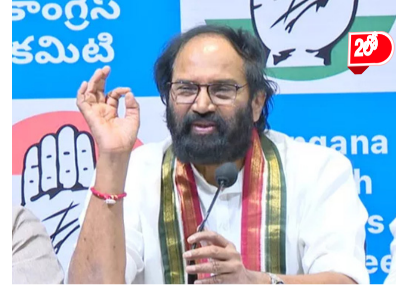
హైదరాబాద్ : గ్యాస్ సిలిండర్ల సరఫరాలో ఏర్పడిన సమస్యలపై రాష్ట్ర పౌరసరఫరాల శాఖ మంత్రి ఎన్. ఉత్తమ్ కుమార్ రెడ్డి సమీక్ష నిర్వహించారు. ఈ సందర్భంగా ఆయన మాట్లాడుతూ.. రాష్ట్రంలో గృహ వినియోగ గ్యాస్ సిలిండర్లకు ఎలాంటి కొరత లేదని స్పష్టం చేశారు. అయితే కమర్షియల్ సిలిండర్ల సరఫరాలో కొంత ఇబ్బంది ఉన్నట్లు వెల్లడించారు. ఇవాళ ఎల్వీజీ