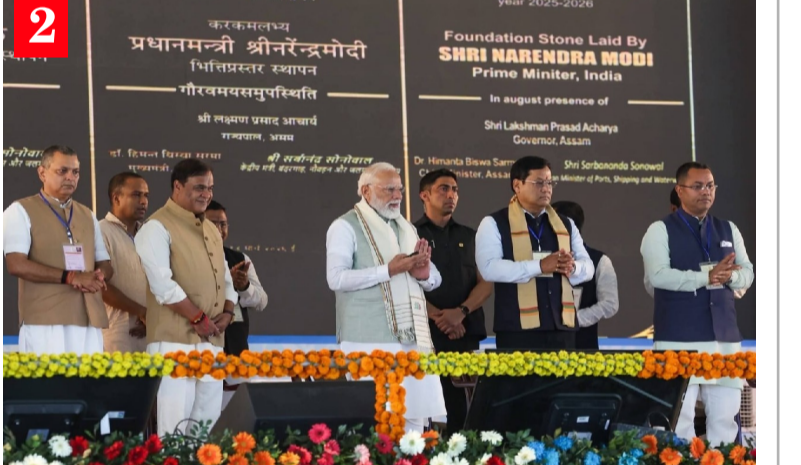
ప్రధానమంత్రి శ్రీనరేంద్రమోదీ ప్రధానమంత్రి అధికార కార్యకర్తలు

జాతీయ ప్రయోజనాల విషయంలో ఆ పాల్ విఫలమైందని ఆగ్రహం వ్యక్తం చేశారు. నిరాశతో దున్నులు చినుకోవడం తప్ప వారికి మిగిలినదేమీ లేదు అబద్ధాలు చెప్పి ప్రజలను ఎలా తప్పుదారి పట్టించాలో తెలుసని ఎద్దేవా చేశారు అసోం ప్రజలు ఇక్కడి నుంచి కాంగ్రెస్ పార్టీని ఎప్పుడో తరిమి కొట్టారని కీకాజిచ్చారు. ఇరాన్, అమెరికా-ఇజ్రాయెల్ మధ్య జరుగుతున్న యుద్ధానికి సంబంధించి భారత్ లో ఆందోళనలు సృష్టించేందుకు కాంగ్రెస్ ప్రయత్నిస్తోంది