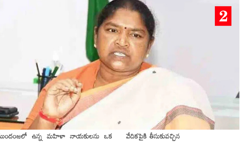
ముందంజలో ఉన్న మహిళా నాయకులను ఒక వేదికపైకి తీసుకువచ్చిన