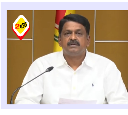
హైదరాబాద్: మంత్రి అజారుద్దీన్ సీఎం రేవంత్ రెడ్డిని ఇష్టాన విందుకు ఆహ్వానించిన