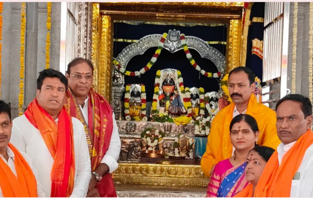
నిజం న్యూస్ కూకట్ పల్లి ప్రతినిధి, మార్చి 21: కూకట్ పల్లి గ్రామంలోని శ్రీ సీత రామచంద్రస్వామి దేవాలయం లో స్వామి