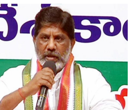
హైదరాబాద్: తెలంగాణలోని ప్రభుత్వ ఉద్యోగులు ఎప్పుడప్పుడూ అని ఎదురుచూస్తున్న డివిడెండ్లు అంశంపై రాష్ట్ర ప్రభుత్వం ఎట్టకేలకు స్పష్టతనిచ్చింది. అసెంబ్లీలో బిట్టెట్ పై చర్చ సందర్భంగా డిప్యూటీ సీఎం మల్లు భట్టి విక్రమార్కు మాట్లాడుతూ, విగతా..26

• అసెంబ్లీ వేదికగా ప్రభుత్వ ఉద్యోగులకు గుడ్ న్యూస్ చెప్పిన మల్లు భట్టి విక్రమార్కు • గత ప్రభుత్వం పెండింగ్లో పెట్టిన మూడు డివైడెండ్లును తమ ప్రభుత్వం త్వరలోనే క్లియర్ • గత బిఆర్ఎస్ ప్రభుత్వం సుమారు రూ. 40 వేల కోట్లకు పైగా బిల్లులను పెండింగ్లో పెట్టింది • లిట్టెంట్ ప్రయోజనాలను కూడా గత ప్రభుత్వం పెండింగ్లో పెట్టిందని, వాటిని కూడా త్వరలోనే చెల్లిస్తాం