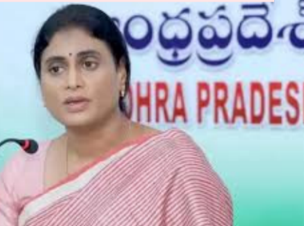
కాంగ్రెస్ అధ్యక్షురాలు వైఎస్ షర్మిల తీవ్రస్థాయిలో స్పందించారు. తన సోదరుడు, ముఖ్యమంత్రి వైఎస్ జగన్మోహన్ రెడ్డిపై సంచలన ఆరోపణలు చేశారు. వివేకానంద రెడ్డి హత్య కేసును పక్కదారి విగతా..26

• ఆస్తుల కోసం కాదు.. న్యాయం కోసమే పోరాటం • విజయమ్మ లేఖ వాస్తవం.. దమ్ముంటే కాదనమనండి • దమ్ముంటే జగనే మాట్లాడాలి అమరావతి: తమ కుటుంబ ఆస్తుల వివరాలపై ఏపీ