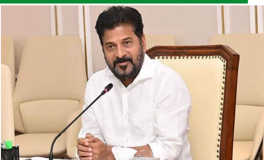
హైదరాబాద్: పెరుగుతున్న జనాభా, వాహనాల రద్దీకి అనుగుణంగా హైదరాబాద్ నగరాన్ని అద్భుత నగరంగా తీర్చిదిద్దాలి ముఖ్యమంత్రి రేవంత్ రెడ్డి ప్రకటించారు. శాసనమండలిలో ఆభివృద్ధిపై జరిగిన చర్చలో పాల్గొన్న ఆయన, భవిష్యత్ అవసరాల దృష్టి నగరాన్ని మూడు ప్రత్యేక జోన్లుగా విభజిస్తున్నట్లు వెల్లడించారు. క్యూర్, ఫ్యూర్, రేర్ విభాగాలుగా ఈ ప్రణాళిక సాగనుంది. విగతా..26

• పెరుగుతున్న జనాభా, వాహనాల రద్దీకి అనుగుణంగా హైదరాబాద్ నగరాన్ని అద్భుత నగరంగా తీర్చిదిద్దాలి • ట్రాఫిక్ రద్దీని తగ్గించడమే లక్ష్యంగా అండర్పాస్లు, సర్కిల్ రోడ్లు మలయలు భారీ ఎలివేటర్ల కారిడార్ల నిర్మాణానికి శ్రీకారం • శాసనమండలిలో అభివృద్ధిపై జరిగిన చర్చలో పాల్గొన్న ఆయన, భవిష్యత్ అవసరాల దృష్టి నగరాన్ని మూడు ప్రత్యేక జోన్లుగా విభజిస్తున్నట్లు వెల్లడించారు • కేంద్ర ప్రభుత్వ నిబంధనల ప్రకారం ప్రభుత్వమే రూ.15 వేల కోట్లు కేటాయించి మెట్రోను స్వాధీనం చేసుకుంది