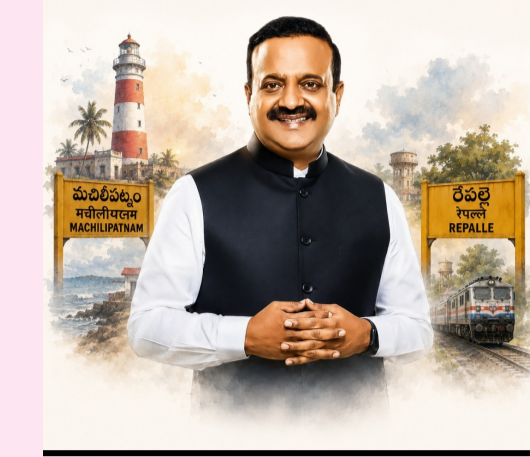
అత్యంత కీలకమని ఎంపీ పేర్కొన్నారు.

ఈ ప్రాజెక్టుకు సంబంధించి ఇప్పటికే పైసల్ లోకేషన్ సర్వే (ఘీనా) పూర్తయ్యింది. భారత రైల్వే శాఖ తన అధికారిక అటానీ మ్యాప్ లో ఈ రూట్ ను అవ్వడే చేయడం ప్రాజెక్టు పురోగతికి నిదర్శనం. ముఖ్యంగా పెనుమాడికి దక్షిణంగా దివీపల ప్రాంతాన్ని కలుపుతూ కృష్ణా నదిపై నిర్మించే భారీ రైల్వే బ్రిడ్జి ఈ ప్రాజెక్టులోనే