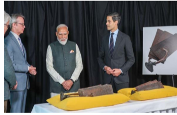
చోళుచేసుకుంది. 11వ శతాబ్దానికి చెందిన చోళుల కాలం నాటి అమూల్యమైన రాగి ఫలకాలు నెదర్లాండ్స్ నుంచి తిరిగి వస్తున్నాయి. నెదర్లాండ్స్లోని ది హేగ్లో నిన్న జరిగిన ప్రత్యేక కార్యక్రమంలో ఈ ఫలకాలను భారత్కు అప్పగించారు. ఈ కార్యక్రమానికి భారత ప్రధాని సరేంద్ర మోదీ, డచ్ ప్రధాని రాబ్ బ్లెఫ్టెన్ హాజరయ్యారు. ఈ రాగి ఫలకాలు సెబ్లో 21 పెద్దవి, 3 చిన్న ఫలకాలు ఉన్నాయి. వీటిపై సంస్కృతం, తమిళ భాషల్లో శాసనాలు ఉన్నాయి. తన తండ్రి రాజరాజ చోళుడు ఇచ్చిన వాణ్ణాన్ని కుమారుడైన రాజేంద్ర చోళుడు అధికారికంగా నెరవేర్చిన చారిత్రక ఘట్టాన్ని ఇవి వివరిస్తాయి. నాగపట్టణంలోని బౌద్ధ విహారానికి అనైమంగళం గ్రామ ఆధారంగానే కేటాయించినట్లు - మిగతా 2 లో