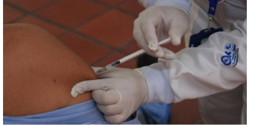
భారతదేశంలో క్యాన్సర్ చికిత్సలో విప్లవాత్మక ముందడుగు పడింది. ఊపిరితిత్తుల క్యాన్సర్ రోగుల కోసం కేవలం ఏడు నిమిషాల్లో పనిచేసే సరికొత్త ఇంజెక్షన్ అందుబాటులోకి వచ్చింది. రోజ్ ఫార్మా ఇండియా సంస్థ 'టెనెంట్రీక్' పేరుతో ఈ ఇమ్యూనోథెరపీ మందును మార్కెట్లోకి విడుదల - మిగతా 2 లో