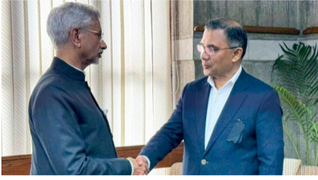
భారత్తో సంబంధాలు కొనసాగడం గంగా నది నీటి పంపకాల ఒప్పందంపైనే ఆధారపడి ఉంటుందంటూ బంగ్లాదేశ్ కొత్త మెలిక పెట్టింది. ఈ మేరకు బంగ్లాదేశ్ నేషనల్స్ పార్టీ (బీఎన్పీ) శనివారం ఒక ప్రకటన విడుదల - మిగతా 2 లో