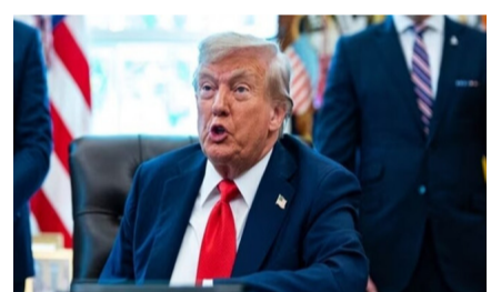
అమెరికాలో తన అధ్యక్ష పదవీకాలం ముగిసిన అనంతరం ఇజ్రాయెల్లో కూడా ప్రధాని పదవికి పోటీ చేయవచ్చని అమెరికా అధ్యక్షుడు డొనాల్డ్ ట్రంప్ సరదాగా అన్నారు. ఆయన మీడియాతో మాట్లాడుతూ, తనకు ఇజ్రాయెల్లో 99 శాతం - మగతా 2 లో