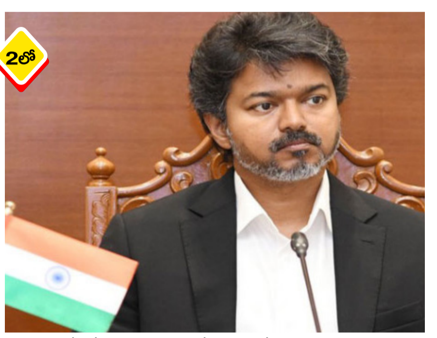
తమిళనాడులో అవినీతిని సమూలంగా నిర్మూలించే దిశగా నూతన ముఖ్యమంత్రి విజయ సంచలన నిర్ణయం తీసుకున్నారు. ప్రభుత్వ కార్యాలయాల్లో లంచం అడిగే అధికారుల వివరాలను వీడియో ఆధారాలతో పట్టిస్తే, ఫిర్యాదు చేసిన వారికి ఏకంగా లక్ష రూపాయల రివార్డ్ అందిస్తామని ప్రకటించారు. ఈ వధకం రాష్ట్రంలో అవినీతిపై పోరాటంలో ఒక కీలక ముందడుగుగా భావిస్తున్నారు. ప్రభుత్వ అధికారి