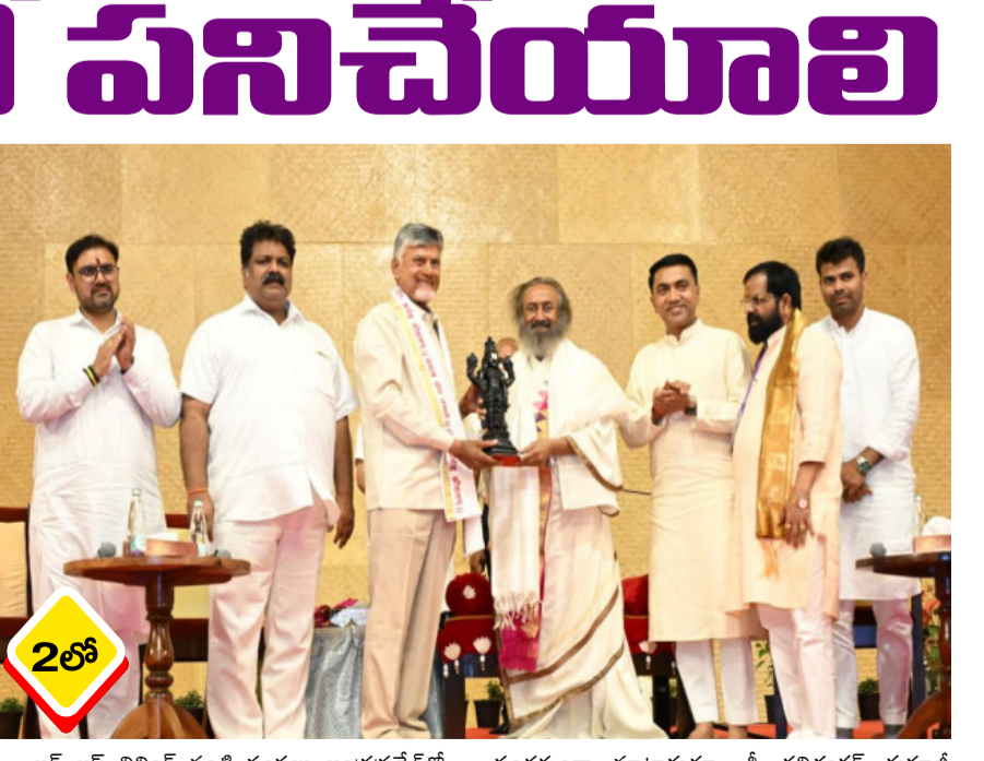
ఆర్ట్ ఆఫ్ లివింగ్ వంటి సంస్థలు ఆంధ్రప్రదేశ్లో పని చేయాలని ఆ రాష్ట్ర ముఖ్యమంత్రి నారా చంద్రబాబునాయుడు కోరారు. ఆర్ట్ ఆఫ్ లివింగ్ సంస్థ వార్షికోత్సవ కార్యక్రమంలో ఆయన పాల్గొన్నారు. ఈ సందర్భంగా మాట్లాడుతూ, శ్రీ రవిశంకర్ గురూజీ జన్మదినోత్సవంతో పాటు ఆర్ట్ ఆఫ్ లివింగ్ ఫౌండేషన్ 45వ వార్షికోత్సవంలో పాల్గొనటం గౌరవంగా భావిస్తున్నానని అన్నారు. కేవలం ఓ