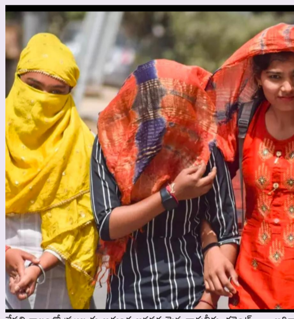
వేసవి కాలంలో ప్రజలకు అత్యంత అవసరమైన తాగునీరు, కరెంటు అధికారులు ప్రత్యేక జాగ్రత్తలు తీసుకోవాలని సీఎం సూచించారు.