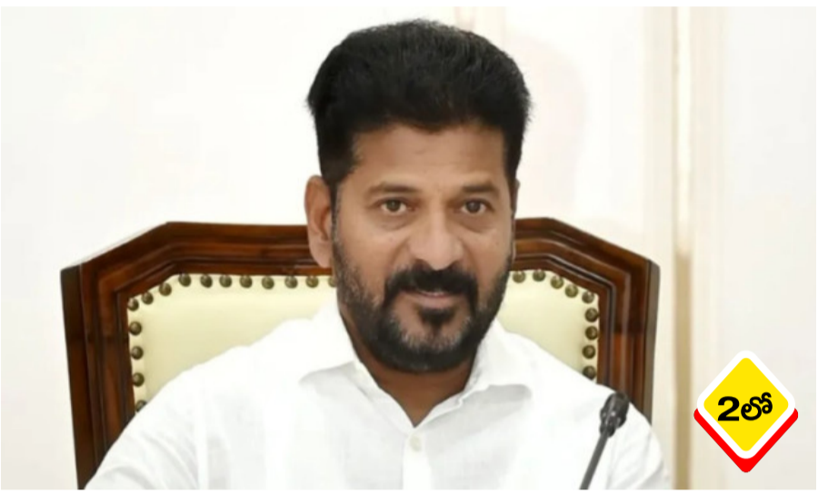
తెలంగాణలో రోజురోజుకూ ముదురుతున్న ఎండల యంత్రాంగాన్ని ప్రజలను అప్రమత్తం చేశారు. ముఖ్యంగా ఉత్తర తెలంగాణ జిల్లాల్లో గరిష్ట