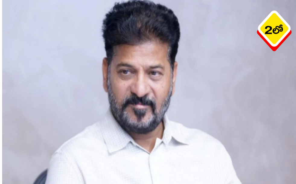
హైదరాబాద్ నగరంలోని నిజాం ఇన్స్టిట్యూట్ ఆఫ్ మెడికల్ సైన్సెస్ (నిమ్మ) యూరాలజీ విభాగం వైద్య చరిత్రలో ఆరుదైన వైద్యురాయిని అందుకుంది. ఇప్పటివరకు 2,000 కిడ్నీ మార్పిడి శస్త్రచికిత్సలను విజయవంతంగా