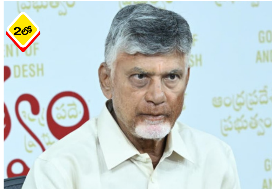
తెలంగాణ టీడీపీ అధ్యక్షుడు బక్కుని నర్సింహులు జాతీయ అధినేత చంద్రబాబు తప్పుపట్టారు. చారిత్రక చేసిన వ్యాఖ్యలను ఆంధ్రప్రదేశ్ ముఖ్యమంత్రి, పార్టీ నేపథ్యం ఉన్న ప్రాంతాల గురించి మాట్లాడేటప్పుడు - మిగతా 2 లో