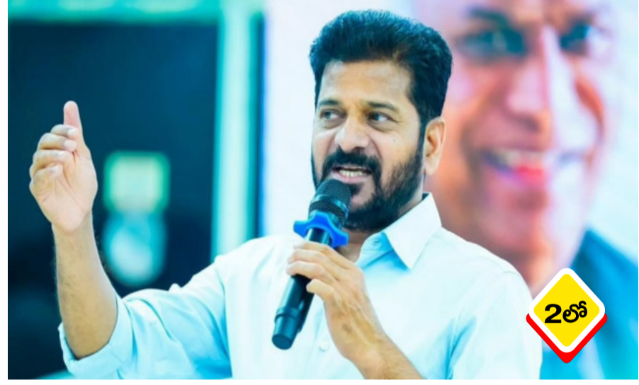
వచ్చు కొనకపోతే బీజేపీ నేతల ఇళ్ల ముందు మోటార్లకు మీటర్లు పెట్టేందుకే 'రైతు డిస్కం' ఏర్పాటు నిరసనలని హెచ్చరిక తెలంగాణలో వ్యవసాయ చేస్తున్నారంటూ ప్రతిపక్ష బీఆర్ఎస్