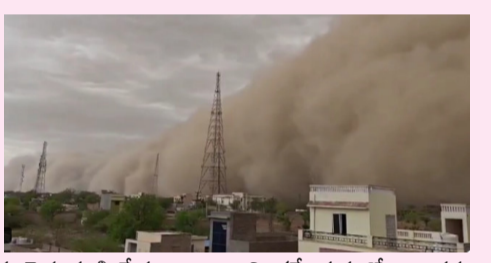
రాజస్థాన్లోని పలు జిల్లాలను శనివారం శక్తిమంతమైన ఇసుక తుపాను ముంచెత్తింది. దట్టమైన ధూళి మేఘాలు ఆకాశాన్ని కమ్మేయడంతో వాతావరణం ఒక్కసారిగా అంధకారంగా మారింది. ఇసుక తుపాను అనంతరం భారీ వర్షం కురిసింది. ఈ తుపాను ప్రభావం చురు జిల్లాపై అధికంగా - మిగతా 2 లో