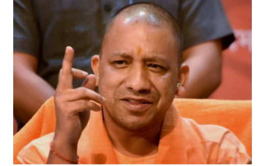
ఉత్తరప్రదేశ్ ముఖ్యమంత్రి యోగి అదిత్యనాథ్ దేశ భద్రత, అహింస, ధర్మరక్షణపై కీలక వ్యాఖ్యలు - మిగతా 2 లో